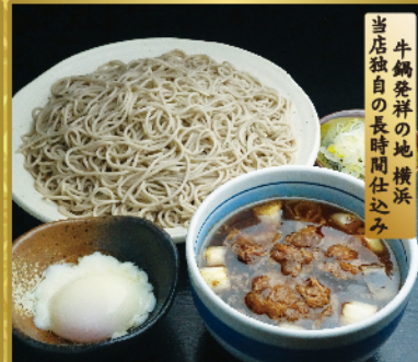
横浜牛せいろそば 1,091円(税込1,200円)