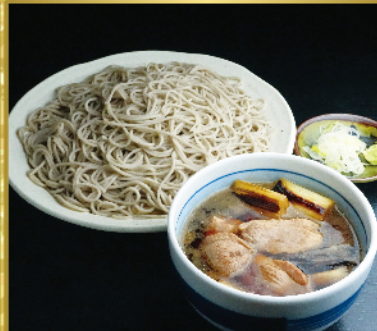
鴨せいろそば 1,045円(税込1,150円)