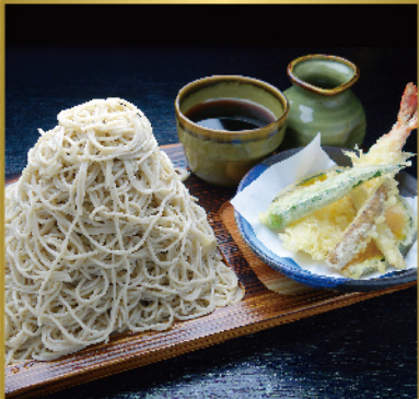
つけ天 富士山もり 955円(税込1,050円)